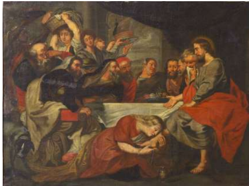
De zalving van Jezus door Maria Schilderij van Peter Paul Rubens (1577-1640)

4. Wij willen worden zoals Hij. Elkanders lasten dragen wij. Wie is er need'rig en klein? Die zal bij ons de grootste zijn. Refrein