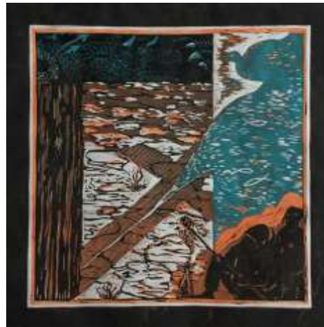
'Ik heb dorst', een kunstzinnige uitbeelding van Riny Dees (vrije grafiek)

6 Wat ben je bedroefd, mijn ziel, en onrustig in mij. Vestig je hoop op God, eens zal ik Hem weer loven, mijn God die mij ziet en redt.